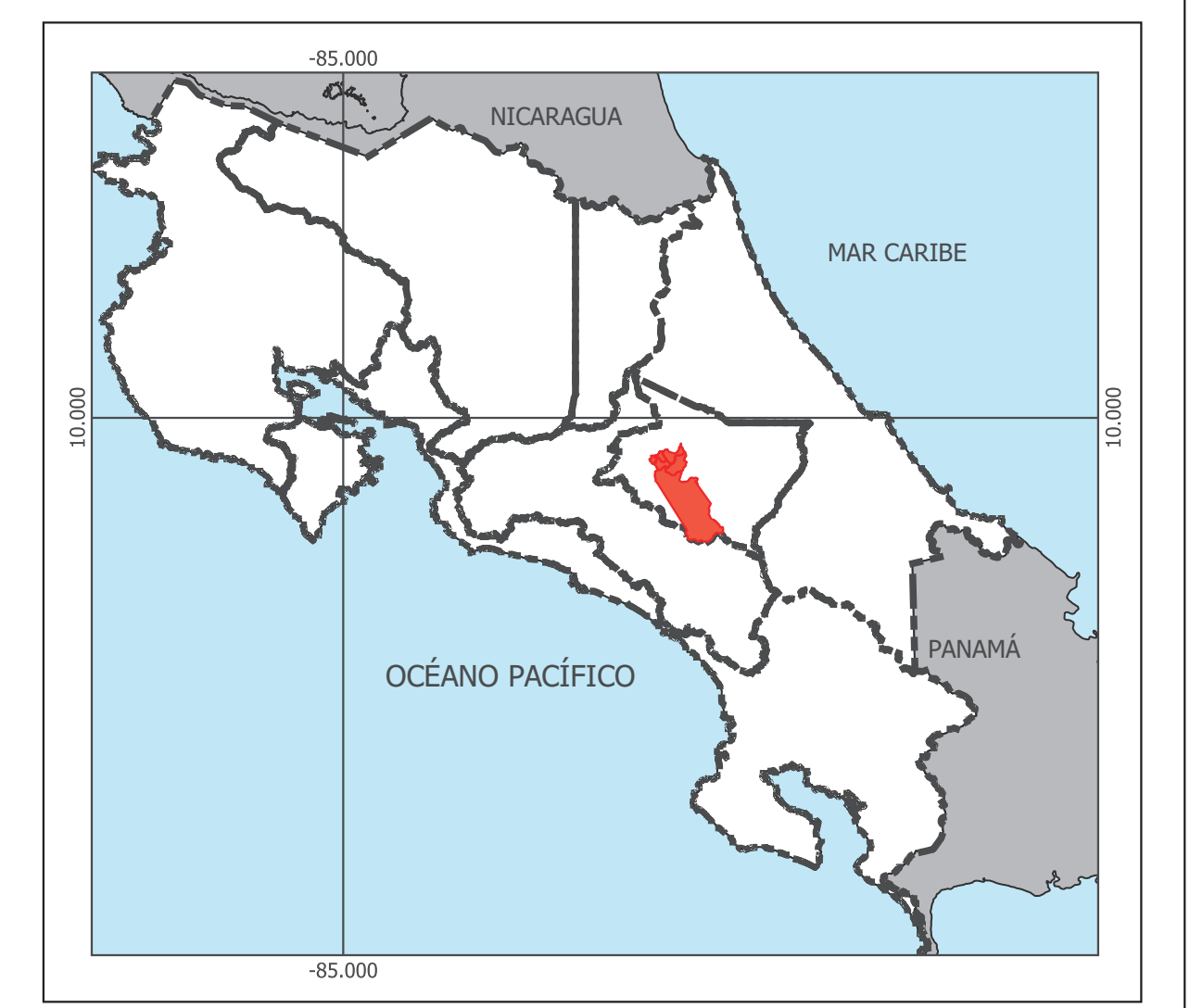
UBICACIÓN DEL CANTÓN PARAISO -- PROVINCIA CARTAGO

FUENTE DE DATOS: MUNICIPALIDAD DE PARAISO Y APD SRL. - Red vial cantonal y propuesta de vialidad - Zonificación del territorio de Paraiso SISTEMA NACIONAL DE INFORMACIÓN TERRITORIAL (SNIT). www.snit.cr - División Territorial Administrativa según límites distritales a escala 1:5 mil. - Localidades según Topónimos a escala 1:5 mil. - Hidrografía según red de drenaje a escala 1:25 mil. - Cuerpos de agua a escala 1:25 mil. - Puentes según datos extraídos de vialidad a escala 1:5 mil, contrastados con la red de drenaje y red vial. - Curvas de nivel a escala 1:25 mil. - Red vial nacional según datos MOPT a escala 1:5mil. SISTEMA NACIONAL DE ÁREAS DE CONSERVACIÓN. http://www.sinac.cr - Áreas Silvestres Protegidas (ASP) 2021. MINISTERIO DE VIVIENDA Y ASENTAMIENTOS HUMANOS (MIVAH). https://geoexplora-mivah.opendata.arcgis.com - Anillo de contención GAM 1982