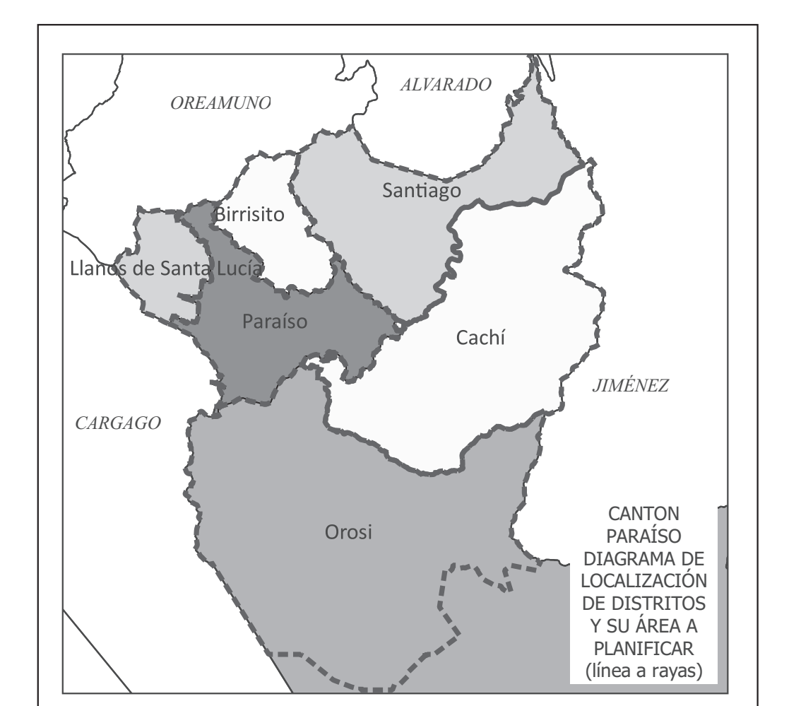
CANTÓN PARAÍSO DIAGRAMA DE LOCALIZACIÓN DE DISTRITOS Y SU ÁREA A PLANIFICAR (línea a rayas)